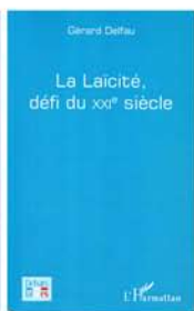
G.Delfau Débats laïques L'Harmattan, 2015