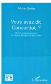
M.Seelig Débats laïques L'Harmattan, 2015